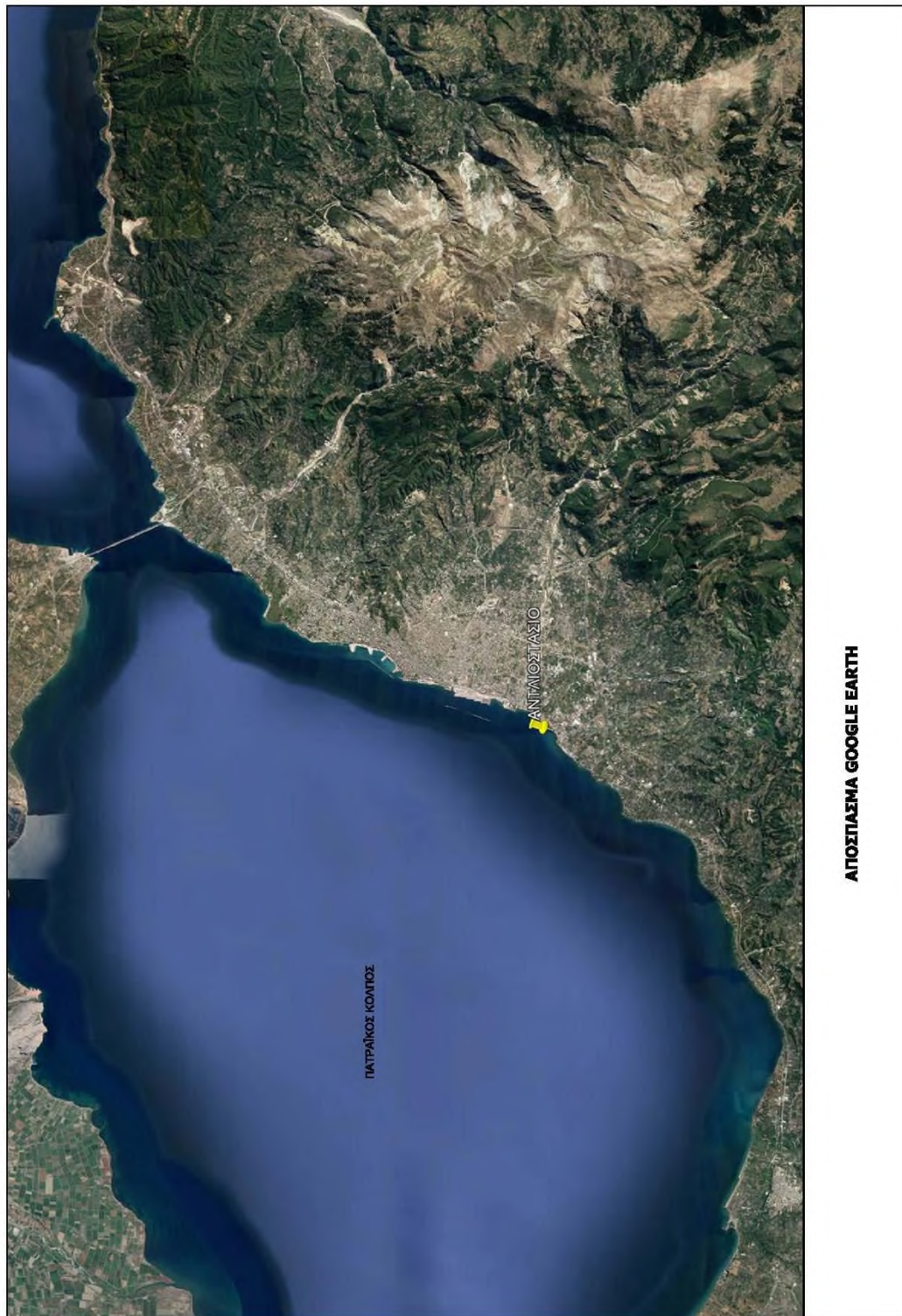
ΘΕΣΗ ΑΝΤΛΙΟΣΤΑΣΙΟΥ ΣΤΟ ΧΑΡΤΗ – ΑΠΟΣΠΑΣΜΑ GOOGLE EARTH